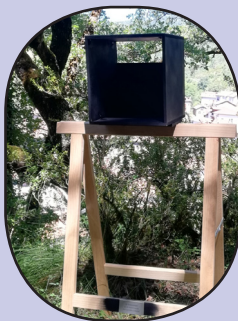
LA IMENSIDAD ES EL MOVIMIENTO DEL HOMBRE INMÓVIL Colectivo BU