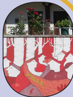
ZAIN-TZA Jone Taberna